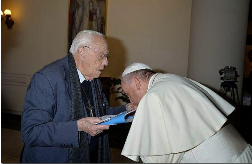
François s'incline devant les journalistes pour baiser la main du prêtre homosexueliste Michele de Paolis, après avoir concélébré avec lui à la Maison Santa Marta

stupéfaits depuis cette salutation inouïe, depuis ce « buona sera » profane et hautement subversif 21 , prononcé dans la loggia de la place Saint-Pierre le 13 mars 2013, porteur d'une charge symbolique telle qu'il permettait déjà à l'époque de présager les calamités sans fin qui allaient survenir par la suite :