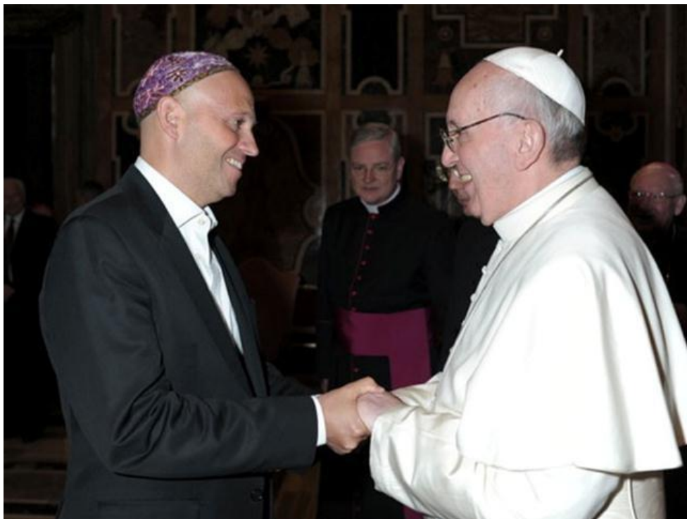
Le rabbin argentin Sergio Bergman affirme avoir trouvé dans le cardinal Bergoglio « son rabbin », car il l'a toujours « écouté et conseillé sur sa vocation », et a contribué à « retrouver les racines juives du catholicisme » durant son ministère en Argentine

Mais, toujours en quête de dépassement et de surenchère dans la recherche d'originalité, voici que François, alias « mon rabbin » (c'est ainsi que l'appelle son ami, le rabbin argentin Sergio Bergman 2 ), à l'occasion d'un sermon prononcé dans la maison Santa Marta , exprima l'idée très originale que l'Eglise ne devrait pas refuser le baptême aux martiens (!!!) 3 . Si tant est qu'ils venaient à le solliciter, bien évidemment... Et ceci parce qu'il semblerait aller de soi que l'Esprit-Saint pousse toujours l'Eglise à aller de l'avant, « à repousser ses limites » et que nous ne devons pas « mettre des obstacles ni fermer les portes » à ceux que nous considérons à tort comme étant « impurs ».