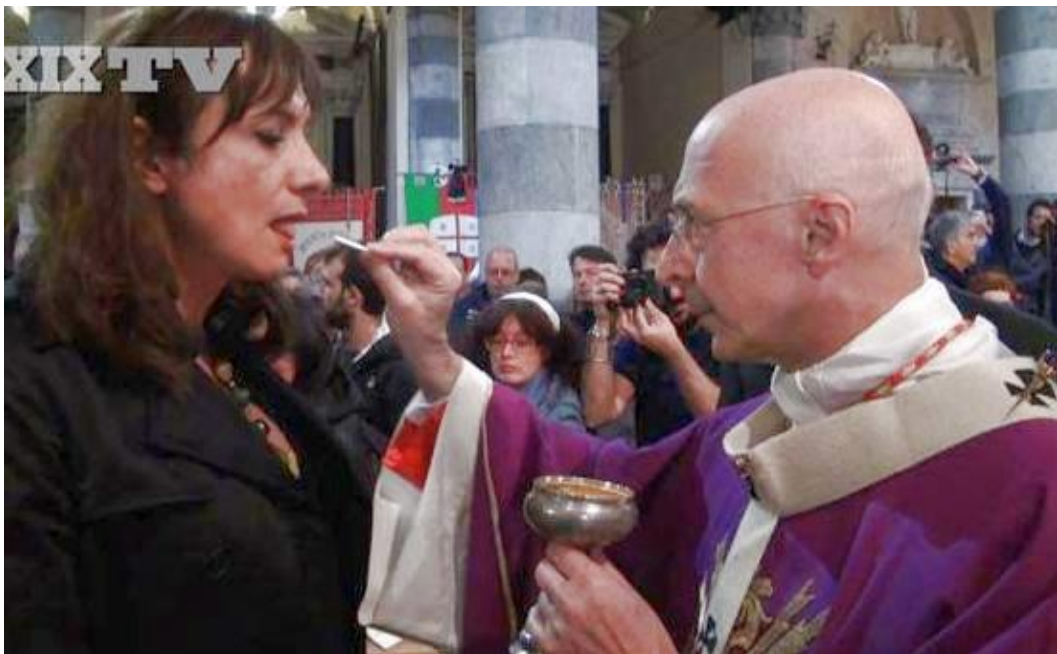
Le cardinal Bagnasco, président de la Conférence Episcopale Italienne , distribuant la Sainte Communion au militant trans-sexuel LGBT Vladimir Luxuria, lors des funérailles du prêtre homosexueliste Don Gallo

Phrase qui était intervenue, faut-il le rappeler, à peine quelques semaines après les très médiatiques funérailles de Don Gallo, fameux prêtre communiste, supporteur ardent du « droit » à l’avortement et champion incontesté de la cause homosexuelle 8 , célébrées avec solennité à Gênes en mai 2013 par le cardinal Angelo Bagnasco, président de la Conférence Episcopale Italienne .