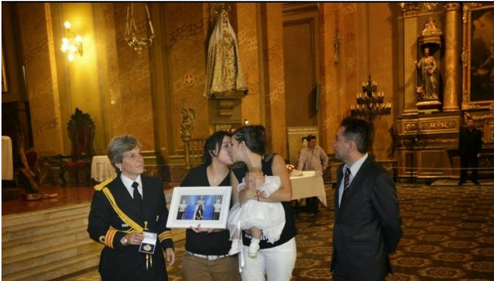
Un duo lesbien profanant la Cathédrale de Córdoba, avec le portrait de la marraine de « leur » enfant, le président argentin, Cristina Kirchner, représentée par un aide de camp en uniforme