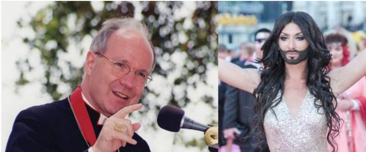
Le cardinal Schönborn, primat d'Autriche, se congratule du succès de son compatriote, la « drag queen » Conchita Wurst, au festival de la chanson de l'Eurovision et demande à Dieu de « bénir sa vie », car il y a « diversité de couleurs dans son jardin multicolore. »

travers les différentes époques » et qu'Elle « est à la recherche de réponses pour le temps présent » 14 .