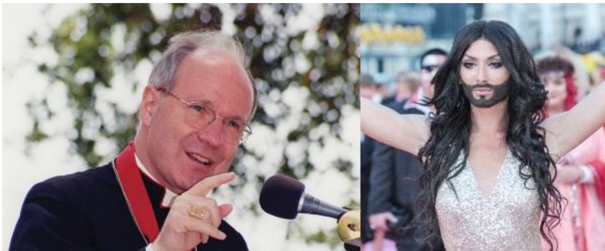
El cardenal Schönborn, primado de Austria, se regocija del triunfo de su compatriota, la « drag queen » Conchita Wurst, en el festival de la canción Eurovisión y pide a Dios que « bendiga su vida » pues « hay variedad de colores en su jardín multicolor. »

Escándalo de proporciones mayúsculas que, huelga decirlo, no provocó ninguna reacción por parte del Vaticano. Podríamos añadir muchísimos otros casos de semejante tenor, como por ejemplo el de la pareja de « madres » lesbianas cuya « hija » fue bautizada con gran pompa mediática en la Catedral de Córdoba el mes pasado 10 , con la anuencia pública del arzobispo del lugar 11 , siendo la madrina nada menos que el Presidente de la Nación Argentina (me estoy refiriendo a la harpía furiosa que engendró el « matrimonio igualitario » y la « adopción homoparental », ahora devenida colaboradora en la « educación cristiana » de la pobre niña...).