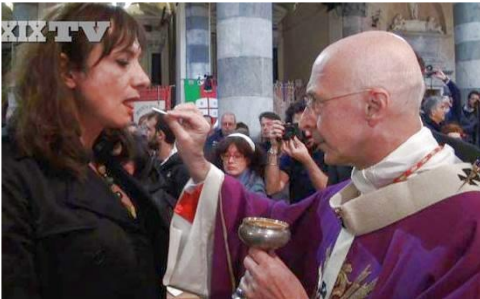
El cardenal Bagnasco, presidente de la Conferencia Episcopal Italiana , dando la comunión al activista transexual LGBT Vladimir Luxuria, durante el funeral del « sacerdote » homosexualista Don Gallo

Esto es lo que decía al respecto en el § 47 : « La Iglesia está llamada a ser siempre la casa abierta del Padre. Uno de los signos concretos de esa apertura es tener templos con las puertas abiertas en todas partes. De ese modo, si alguien quiere seguir una moción del Espíritu y se acerca buscando a Dios, no se encontrará con la frialdad de unas puertas cerradas. Pero hay otras puertas que tampoco se deben cerrar. Todos pueden participar de alguna manera en la vida eclesial, todos pueden integrar la comunidad, y tampoco las puertas de los sacramentos deberían cerrarse por una razón cualquiera. Esto vale sobre todo cuando se trata de ese sacramento que es la puerta, el Bautismo. La Eucaristía, si bien constituye la plenitud de la vida sacramental, no es un premio para los perfectos sino un generoso remedio y un alimento para los débiles. Estas convicciones también tienen consecuencias pastorales que estamos llamados a considerar con prudencia y audacia. A menudo nos comportamos como controladores de la gracia y no como facilitadores. Pero la Iglesia no es una aduana, es la casa paterna donde hay lugar para cada uno con su vida a cuestas. »